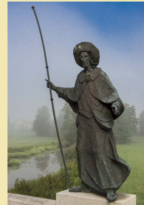
St. Jakobus auf der Großsajgener Brücke