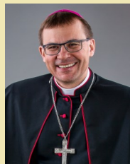
Tomáš Holub Bischof von Pilsen